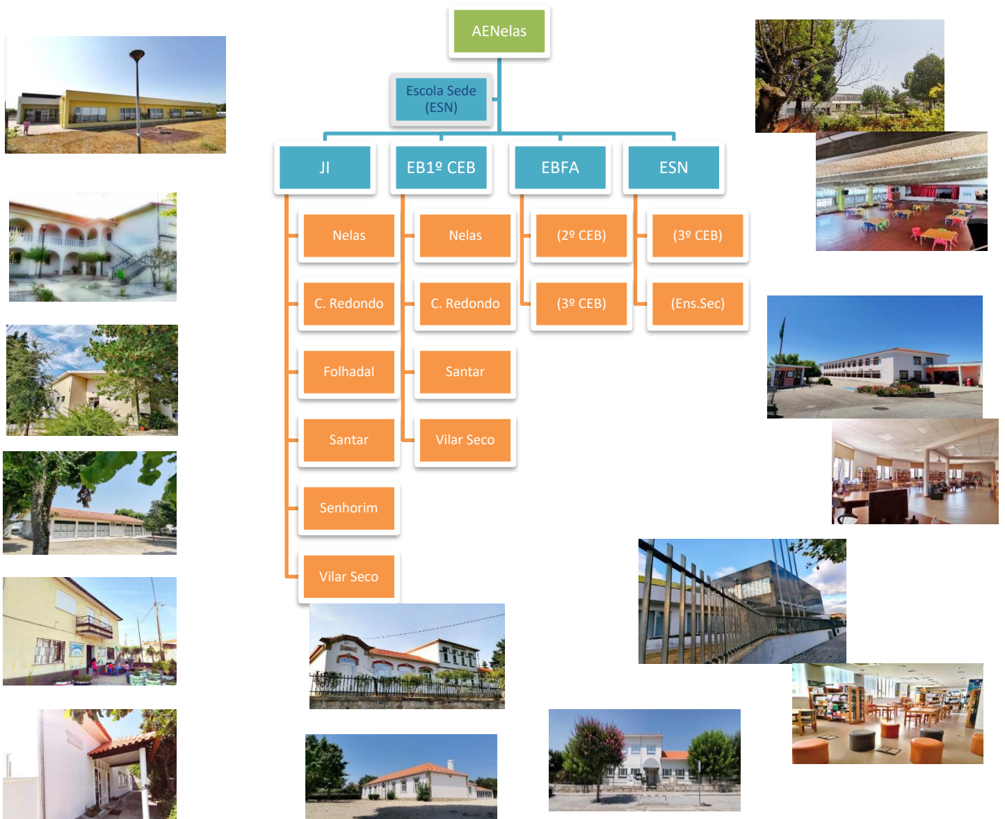
Fig. 1 – Distribuição dos alunos por ciclos e escolas

Atualmente, o Agrupamento de Escolas de Nelas engloba, em termos geográficos e de acordo com a sua área de influência, estabelecimentos de ensino das freguesias de Carvalhal Redondo (União de Freguesias de Carvalhal Redondo e Aguieira), Santar (União de freguesias Santar e Moreira), Senhorim, Vilar Seco e Nelas, plasmados no seguinte organograma: